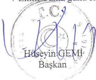
Hüseyin GEMİ Başkan

7 Ekim Cuma günü saat:15.00 da toplanmak üzere oturum kapatıldı.